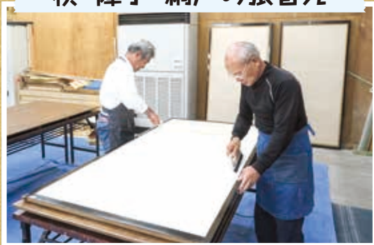
襖・障子・網戸の張替え