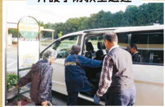
介護予防教室送迎