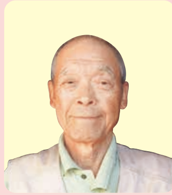
神山 室伏 亘